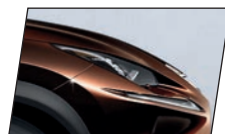
Marrom Âmbar (4X2)