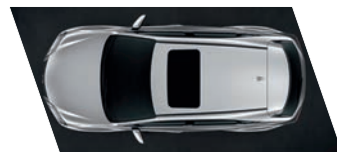
Teto solar (a) com barras longitudinais (versão Luxury)