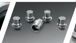
Kit de segurança da roda