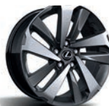
Rodas de liga leve de 18"