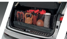
Rede do porta-malas