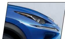
Azul Meteoro (8X9)