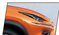
Laranja Lava (4W7)