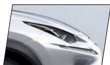
Branco Sônico (085)