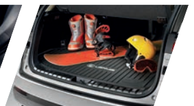
Bandeja do porta-malas