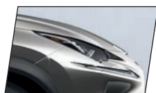
Cinza Titânio (1J7)