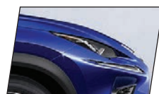
Azul Olímpio (8X1)