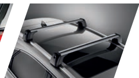
Barras transversais do teto (versão Luxury)