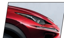
Vermelho Coral (3R1)