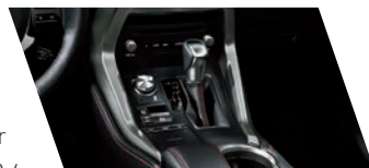
Transmissão Hybrid Transaxle

Resultado da combinação eficiente de um motor a combustão com um motor elétrico