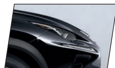
Preto Grafite (223)